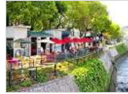
水辺のオープンカフェ*