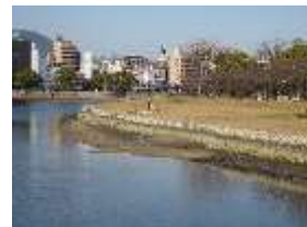
基町環境護岸(本川)