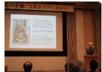
杉本氏の基調講演