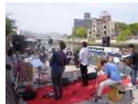
水辺のコンサート*