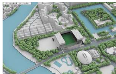
イメージ・パース

近隣住民は一時的な騒音や交通渋滞を問題にしているが、高さ約40mの巨大な箱モノが建つことによる日影や眺望景観の悪影響や治安の不安の方が重大と思う。他にも試合のない日の活用策や現スタジアムの扱いなど課題が山積しており、 市民への丁寧な説明が求められる。