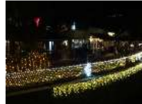
夜のオープンカフェ